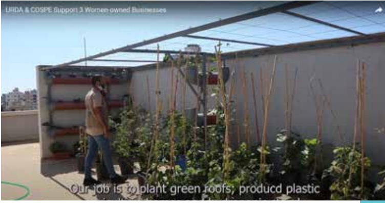
لمشاهدة الفيديو اضغط على الصورة

تمكن مشروع WEE.CAN التابع لئورداء، وبالتعاون مع COSPE من دعم 3 مشاريع تجارية مختلفة تملكها النساء، وتلقت المستفيدات مساعدات نقدية ساعدتهن على تطوير عملهن وشراء معدّات جديدة وضمان استدامتها. ويعتبر دعم المشاريع الصغيرة والمتوسطة الحجم للوصول إلى توليد الدخل هو أحد أهم أهداف قطاع سبل العيش في أورداء.