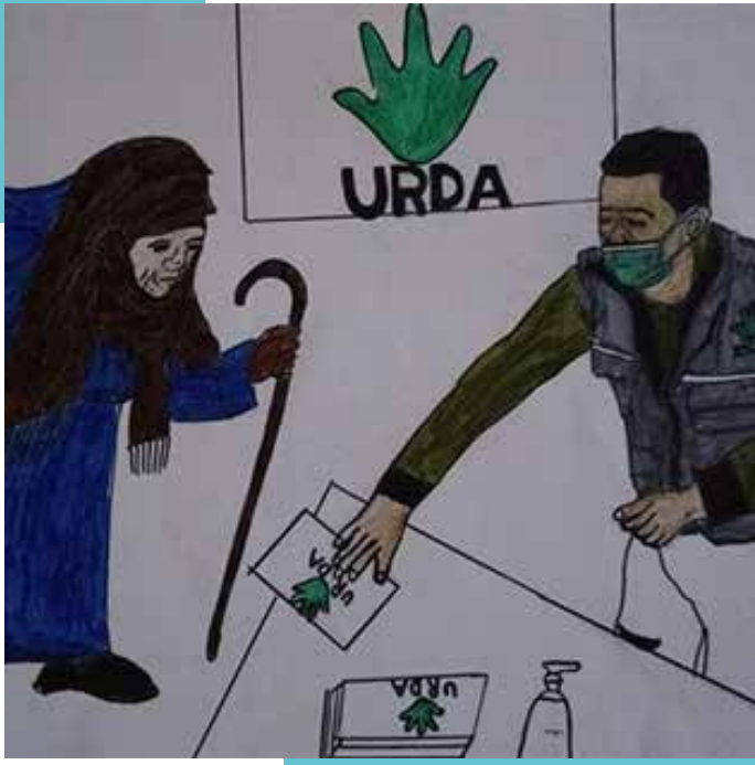
من رسم أحد أمهات الأيتام المكفولين

من هذا المنطلق، يعمل قطاع الكفالات في URDA على تخفيف حدة الأثمة عن بعض الفئات الضعيفة من أيتام وفقراء، ويسعى جاهداً إلى البحث عن مصادر إضافية من المتبرعين والمانحين من أجل توسيع شريحة الفئة المستهدفة والعمل على مساعدة أكبر قدر ممكن من المحتاجين.